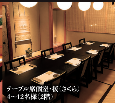
テーブル席個室・桜(さくら) 4~12名様(2階)