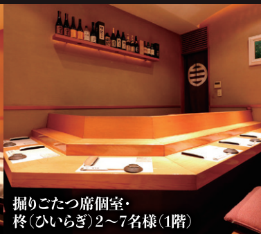
掘りこたつ席個室・ 終(ひいらぎ)2~7名様(1階)