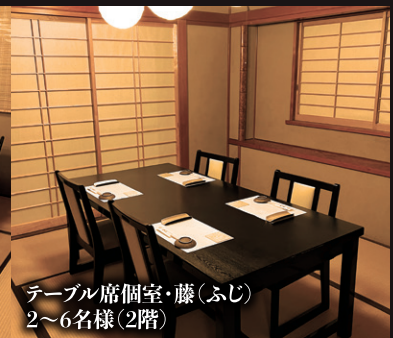
テーブル席個室・藤(ふじ) 2~6名様(2階)

ご利用シーン お食い初め、七五三、お祝い事のお食事会、両家顔合せ、お誕生日会、法事など 接待、忘年会、新年会、歓送迎会など ※お子様用のイスもご用意しております。 2階の個室は最大20名様までご利用いただけます。